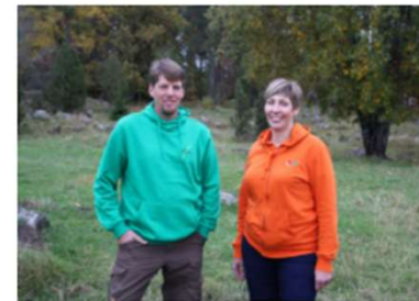
Monimuotoisuus tasaa viljelyn riskejä