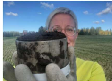
Tutkimustietoa peltojen hiilensidonnasta