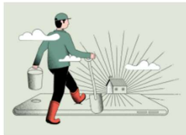
Maksimoi maan kasvukunto