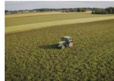
Tuki kannustaisi ilmastotoimiin