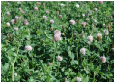
Helli peltoa ympäristötoimilla