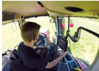
AgriHubi tuo viljelijän äänen tutkimukseen

Vihreä kasvu on maataloudelle ja maaseudulle mahdollisuus